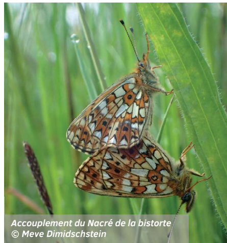
Accouplement du Nacré de la bistorte

Au cours de la balade, le groupe a pu observer quelques espèces rares de papillons, tels que le Nacré de la bistorte, Boloria eunomia , qui dépend exclusivement de cette plante, car elle est à la fois son lieu de ponte, la nourriture de ses larves et sa source de nectar.