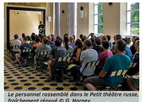
Le personnel rassemblé dans le Petit théâtre russe, fraîchement rénové

C'est dans le cadre magnifique du domaine Saint Roch que cette journée de détente et de réflexion s'est déroulée pour plus de 70 membres du personnel de Natagora. Après l'accueil, les volontaires de la régionale Entre-Sambre-et-Meuse ont fait découvrir les nombreux aménagements en faveur de la biodiversité réalisés dans le domaine. Au retour, une cérémonie de labellisation des entrepreneurs ayant suivi la formation La biodiversité en espace vert a été célébrée par l'équipe du Réseau Nature. Après le repas, composé entre autres de plantes sauvages et de bières locales, la présentation du groupe de travail Vis ma vie et quelques échanges ont clôturé cette belle journée ensoleillée.