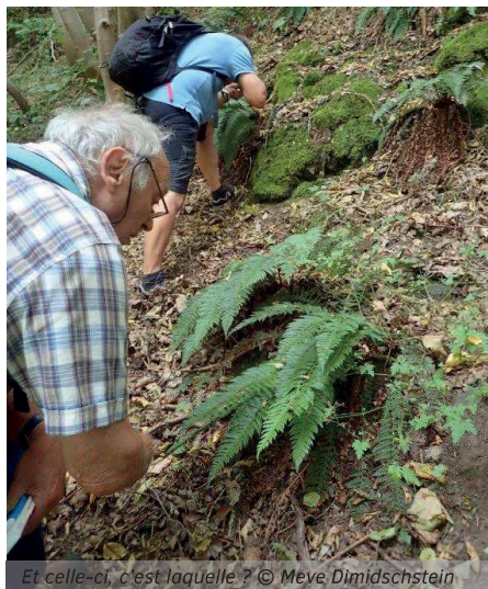
Et celle-ci, c'est Jaquelle ?

Au total, une dizaine d'espèces a pu être identifiée, dont certaines plus rares, comme la Fougère des montagnes qui, froissée, dégage un agréable parfum d'agrumes et le Polystic à aiguillons, capable de persister durant l'hiver.