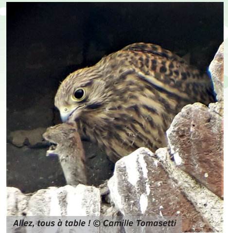
Allez, tous à table !

C'est ainsi que le lendemain j'ai pu observer et photographier à loisir ce qui s'avérait être une nichée de Faucons crécerelles, installée dans l'œil de bœuf de la maison voisine. J'y ai entre autres noté le comportement particulier des parents qui, lorsque les jeunes avaient atteint « la taille d'envol », faisaient mine de leur présenter une proie pour repartir ensuite sans la céder. Histoire de dire : « Allez les enfants, oust, il est temps de prendre votre envol si vous voulez manger ! ». Quelques jours après, Camille m'a informé que les 5 petits s'étaient envolés en s'égaillant dans la nature proche.