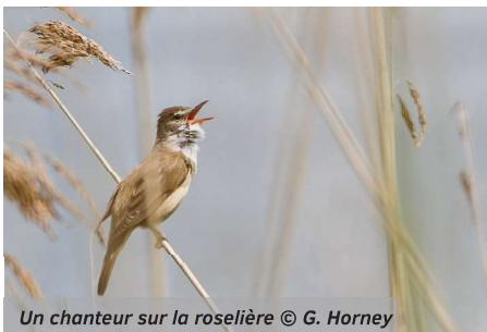
Un chanteur sur la roselière

Monsieur et madame Rousserole turdoïde ont le plaisir de vous annoncer la naissance de leurs enfants dans la roselière de l'Étang de Virelles. Arrivé dès début mai, un premier chanteur s'y manifeste bruyamment. Il est rejoint plus tard par un deuxième oiseau, sans doute une femelle, puis par un troisième plus timide et systématiquement chassé des parages par le premier chanteur. Voici plusieurs années maintenant que la réserve naturelle abrite les amours de cette espèce très rare pour l'ESM. Preuve, s'il en est, de l'attrait de notre belle réserve.