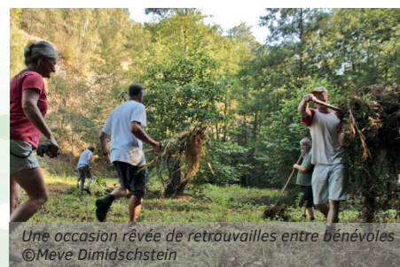
Une occasion rêvée de retrouvailles entre bénévoles

Comme chaque année depuis 1988, quelques bénévoles ont pris râteaux et fourches pour nettoyer une partie de la réserve naturelle C.N.B. du Fond de Noye (affluent en rive droite du Viroin, à Olloy). La gestion concerne un fond humide, maintenu à l'état d'un pré maigre grâce à un fauchage bisannuel. En effet, chaque année, une moitié est fauchée, tandis que l'autre est laissée intacte pour permettre à la faune et à la flore d'y accomplir son cycle de reproduction. Pour cette édition, une dizaine de personnes s'est attelée à la tâche en ramassant et en rassemblant en grands tas épars les branches et branchettes tombées au sol ainsi que le produit de la fauche. Tout en offrant le gîte à une partie de la faune, comme la Couleuvre à collier, cette opération évite l'enrichissement du sol par l'accumulation des déchets végétaux. Ce nettoyage est également l'occasion