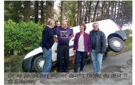
On ne paraît pas inquiet devant l'objet du délit ?!