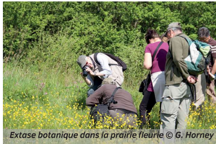
Extase botanique dans la prairie fleurie

a montré la richesse des lieux habités, entre autres par quelques Agrions jouvencelles ou encore par la Libellule déprimée. L'après-midi a été consacrée au contrôle par Arnaud, Rémy et Georges des 11 nichoirs à destination des Moineaux friquets, installés à Matagne-la-Petite. Le constat hélas fut très décevant : aucun friquet découvert, la plupart des nichoirs étant ou ayant été occupés par des mésanges ou des moineaux domestiques. Dans 6 nichoirs, des mésanges charbonnières et des poussins sont trouvés morts, ainsi que 7 œufs abandonnés... un carnage, dû sans nul doute aux conditions météo froides et humides des jours précédents.