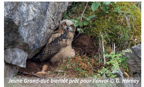
Jeune Grand-duc bientôt prêt pour l'envol

Le Grand-Duc et la Grande-Duchesse ont le plaisir de vous annoncer la naissance de deux héritiers dans leur domaine du Fondry des Chiens. Ceux-ci se portent à merveille comme vous pouvez vous en rendre compte sur le cliché « officiel » ci-dessous où l'un des frères pose obligeamment pour le photographe.