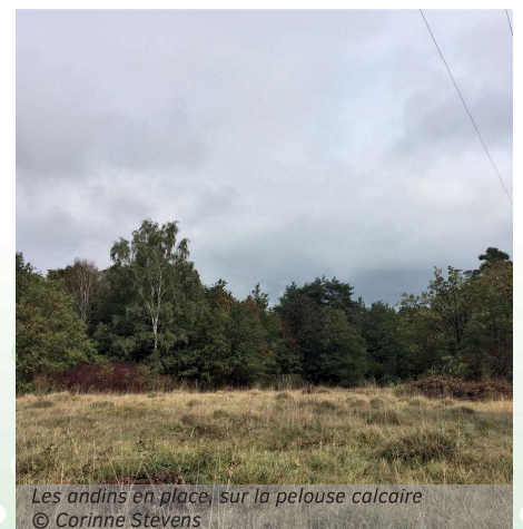
Les andins en place, sur la pelouse calcaire

Sage décision, car sous une plus grosse touffe d'herbe, Arnould a eu la surprise de découvrir une Couleuvre coronelle. Fallait la voir ! Adulte, enroulée, elle occupait à peine quelques centimètres carrés ! Elle s'est déplacée d'un mètre pour rejoindre un tas voisin que nous avons « regarni » pour le renforcer. Elle a été découverte à 2 m environ de la lisière nord, dans le mesobrometum. Une belle confirmation de l'intérêt de multiplier des tas au cœur de la pelouse. A ce propos, merci de faire passer la consigne aux différents acteurs de terrain : les tas ne sont pas des oublis mais bien des refuges laissés volontairement sur place pour les reptiles !