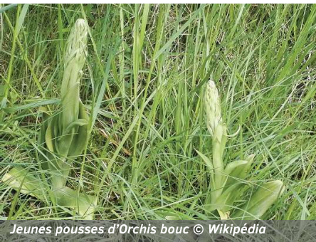
Jeunes pousses d'Orchis bouc

Au programme, découverte de l'ancienne carrière d'Aisemont, réaménagée en pelouse calcaire protégée. C'était pour beaucoup de participants l'occasion de découvrir les multiples richesses, principalement botaniques, présentes sur le site. Parmi ces découvertes, de nombreux pieds d'Orchis bouc au début de leur épanouissement.