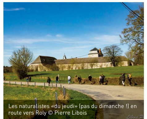
Les naturalistes «du jeudi» [pas du dimanche !] en route vers Roly

Pour le retour du printemps, sous un soleil radieux, une vingtaine de participants venus des 4 coins de la Wallonie était présente à Roly. Entourés des chants des verdiers, accenteurs et grives (musiciennes et drains) nous avons traversé le village et rejoint la réserve du "Vivi des bois". Là, nous avons pu observer les premiers migrants de retour : des Pipits farlouses se poursuivant en tous sens, des Tarriers pâtres très mobiles et haut dans le ciel, un couple de Buses variables tournoyant sous le soleil. Pour terminer la balade, afin de respecter la tradition et effectuer le «débriefing», nos retrouvailles ont été scellées autour d'une table conviviale !