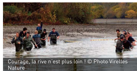
Courage, la rive n'est plus loin !