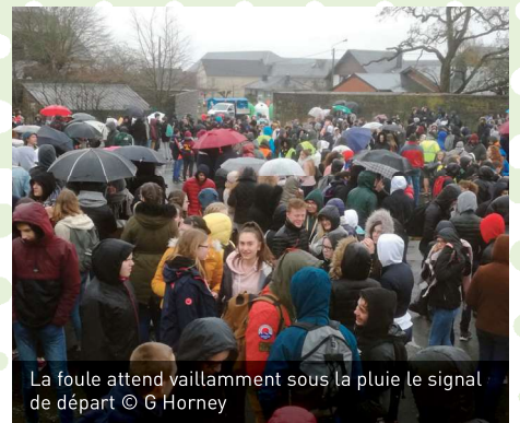
La foule attend vaillamment sous la pluie le signal de départ

Sous une pluie battante à dégoûter même un canard, plusieurs centaines de courageux armés d'un parapluie ont bravé les averses afin de marquer leur soutien aux marches des jeunes pour le climat. L'écrasante majorité des manifestants était composée d'étudiants provenant des différentes écoles de la ville. Même si la régionale y était présente, on regrettera la faible représentation des associations de protection de la nature ainsi que des seniors.