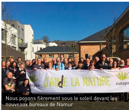
Nous posons fièrement sous le soleil devant les nouveaux bureaux de Namur

Chacun a eu l'occasion de s'exprimer et de partager sa perspective. Si vous voulez en savoir plus, il vous suffit de consulter le site de Natagora en cliquant sur le lien suivant : https://volontariat.natagora.be