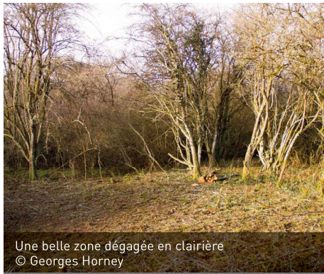
Une belle zone dégagée en clairière

Lors de la gestion de décembre, nous avons principalement débroussaillé autour de l'ancienne mare, pour limiter l'envahissement par les herbes hautes et les prunelliers. Aujourd'hui, l'objectif a été d'ouvrir davantage l'espace concerné et de le relier à une autre zone intéressante, en créant un couloir. Cet site présente beaucoup d'intérêt du point de vue herpétologique, comme a pu le constater Christophe, voisin de la réserve et très actif dans sa gestion, qu'il maintient avec l'aide d'amis. Le retour des orchidées y est également espéré. Pour en savoir plus, lire l'article consacré à cette réserve, proposé dans les pages précédentes.