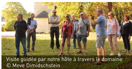
Visite guidée par notre hôte à travers le domaine