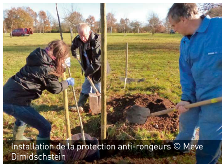
Installation de la protection anti-rongeurs