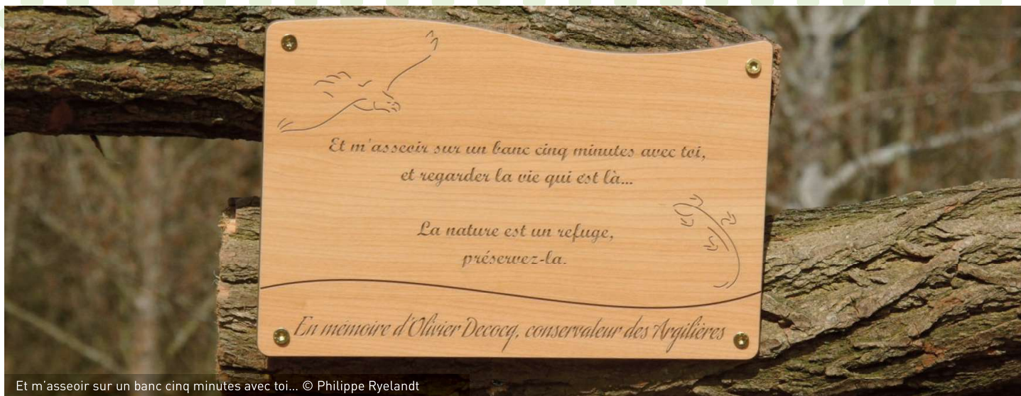
Et m'asseoir sur un banc cinq minutes avec toi...