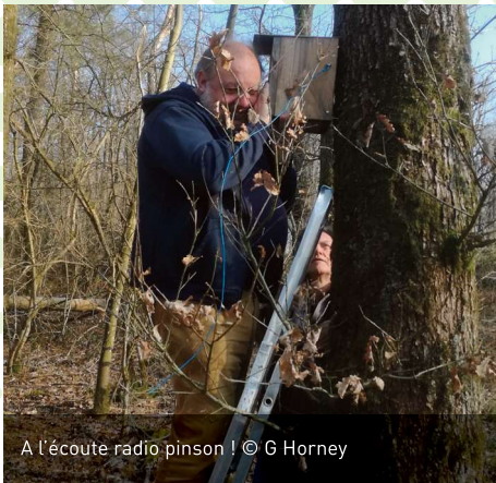
A l'écoute radio pinson !