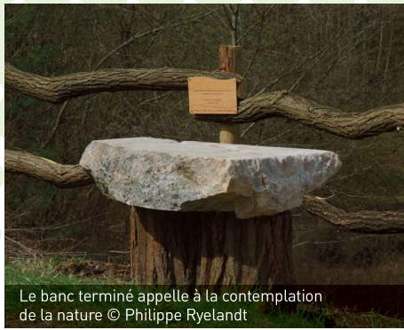
Le banc terminé appelle à la contemplation de la nature