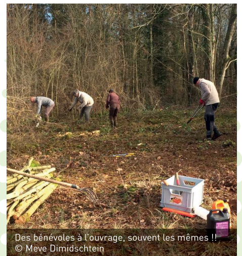
Des bénévoles à l'ouvrage, souvent les mêmes !!

Comme annoncé, deux samedi et un jeudi de janvier et février ont pu être consacrés à la restauration du site naturel des Roches à Petigny. Une bonne demi-douzaine de bénévoles courageux a retroussé ses manches pour dégager sentiers, points de vue, zones rocheuses et ancienne carrière, mais aussi pour faucher/ramasser trois parcelles dans la pelouse calcicole. Cette gestion a été rendue possible grâce au travail préalable de coupe réalisé par un jeune entrepreneur du village, dont le défraiement fut assuré par une récolte de fond lors d'un jeu de boules. Un tas imposant de branches doit encore être broyé par le service communal. Pour découvrir la gestion entreprise en 2017, ne ratez pas l'excursion du 25 mai après-midi.