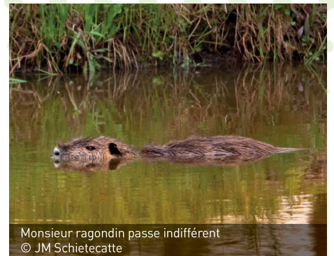
Monsieur ragondin passe indifférent

loi leur attribue. Il n'est plus rare en effet de rencontrer des lambeaux de haies un peu partout, laissés par des agriculteurs peu scrupuleux et avides de gagner quelques malheureux mètres carrés de terre cultivable. Et cela, au détriment de la biodiversité qui ne semble pas être leur priorité. Espérons que la loi sera appliquée contre cette incivilité flagrante, avec rigueur cette fois.