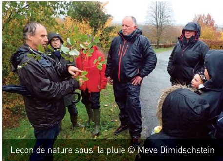
Leçon de nature sous la pluie

Il fait rarement beau le 11/11 et à ses alentours. C'est pourtant à ce moment, depuis bien des années, que les scouts de Petigny organisent plusieurs journées d'activités liées aux vergers. C'est tout bénéfique pour ce village "aux mille pommiers" puisqu'en achetant des vergers, ils en ont assuré le suivi par des tailles de restauration, entretenu les prés et récolté les fruits. Ces derniers sont ensuite transformés en cidre et vins de fruits. Outre une initiation à ces techniques de transformation, une excursion thématique permet d'aborder la nature autour des vergers, mais aussi la réalisation de plantations d'arbres fruitiers. Une exposition de fruits présente en outre les variétés de pommes typiques du sud de l'Entre-Sambre-et-Meuse. Enfin, la vente des produits, ainsi que les repas proposés sur place, servent à financer leurs divers projets et camps. ... Ou comment joindre l'utile à l'agréable !