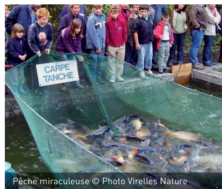
Pêche miraculeuse

La traditionnelle vidange de l'étang de Virelles a attiré un public nombreux autour de ses berges accessibles de l'étang. Le spectacle des «pêcheurs» tirant ces immenses filets remplis de poissons frétilants et bondissants semble ne jamais lasser les spectateurs et autres amateurs de grosses carpes.