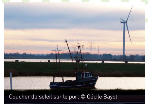
Coucher du soleil sur le port

pour la traversée en ferry depuis Flessingue. Et avant de quitter Breskens à regret, il s'offre une dernière tentative au phare de la localité, lieu apprécié des ornithologues lors des migrations. Il n'y aura pas beaucoup d'oiseaux à observer, par contre un merveilleux coucher de soleil sur la mer et sur les paysages environnants, va littéralement charmer tous les participants et imprimer dans leur mémoire un merveilleux souvenir!