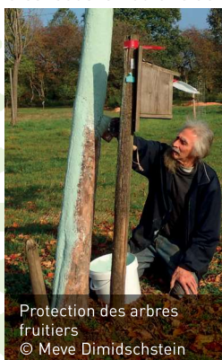
Protection des arbres fruitiers

Rendez-vous annuel maintenant bien établi, la fête du parc naturel Viroin-Hermeton des 18 et 19 octobre permet aux personnes intéressées par les arbres fruitiers de se renseigner. Deux visites sont organisées, le samedi après-midi au verger Sous-St-Roch à Nismes, consacrée aux arbres plantés en haute-tige et le dimanche matin, au verger Notre-Dame d'Olloy-sur-Viroin, consacrée aux arbres en basse-tige et palissés, aux petits fruits ainsi qu'aux vignes de table. C'est sous la houlette de Meve Dimidschstein et