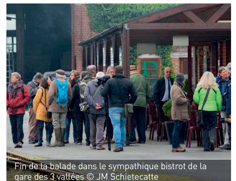
Fin de la balade dans le sympathique bistrot de la gare des 3 vallées