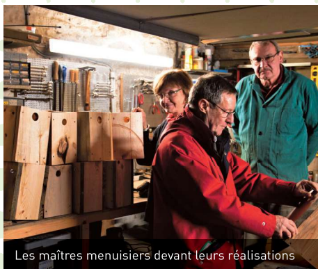
Les maîtres menuisiers devant leurs réalisations

En continuation de la démarche de la régionale pour favoriser le retour des Moineaux friquets en ESM, une deuxième campagne de fabrication de nichoirs a réuni des bénévoles pour en construire une trentaine. Leur installation est programmée pour le 28 mars.