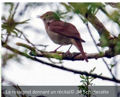
Le rossignol donnant un récital

Hélas, le plaisir de cette matinée fut quelque peu gâché par la découverte de la disparition de plusieurs centaines de mètres de haie longeant le Ravel. Même si les agents du DNF local, avertis par un collègue présente, ont constaté les faits, force est de reconnaître que ce phénomène a repris de l'ampleur et qu'il est observé un peu partout dans la région malgré la protection que la