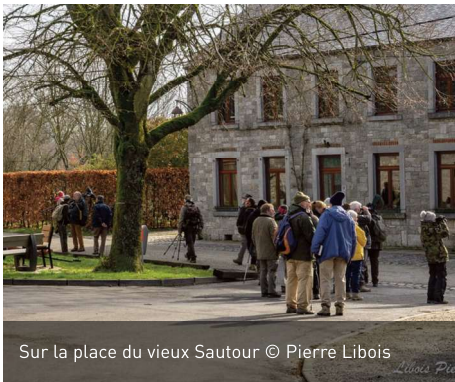
Sur la place du vieux Sautour

Malgré un ciel un peu grincheux, ils étaient plus d'une vingtaine venant de tous les horizons pour participer à cette quatrième édition des jeudis du naturaliste. Le départ était prévu depuis le vieux village historique de Sautour. Après une courte évocation de l'histoire de ce beau village dispensée par Georges, nous avons suivi André dans les chemins pittoresques de la campagne aux alentours. Hirondelles, alouettes et bruants étaient au rendez-vous. La forte participation aux dernières éditions confirme le succès et l'intérêt de ce genre d'initiative.