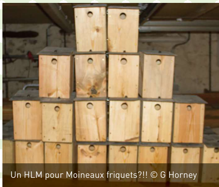
Un HLM pour Moineaux friquets?!