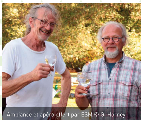
Ambiance et apéro offert par ESM