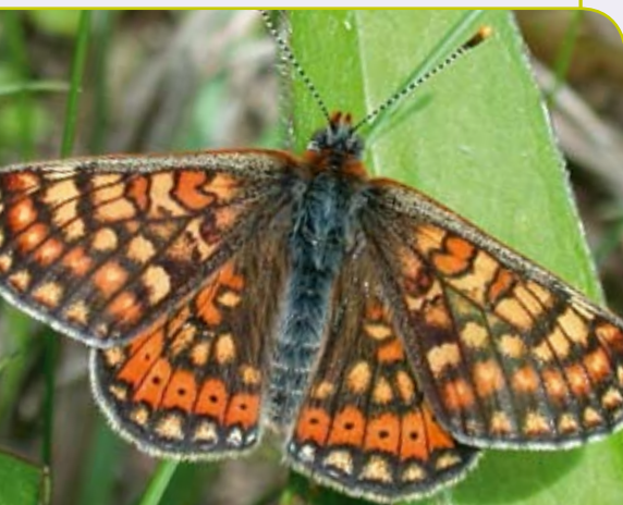
Le damier de la succise a souffert de l'intensification agricole et est devenu un des papillons les plus menacés en Wallonie. Natagora restaure des habitats pour cette espèce en Fagne-Famenne.