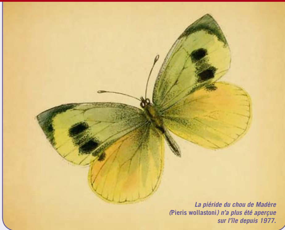
La piéride du chou de Madère (Pieris wollastoni) n'a plus été aperçue sur l'île depuis 1977.

Les poils de la trichie fasciée dont la larve vit dans le bois mort permettent le transport passif de pollen d'une fleur à l'autre.