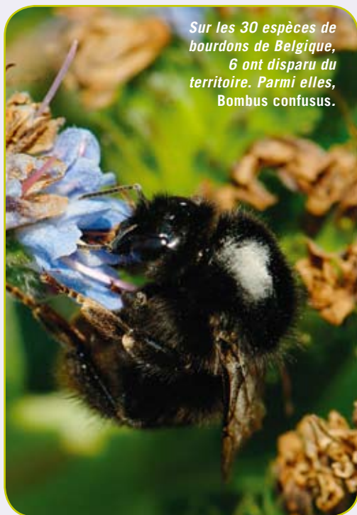
Sur les 30 espèces de bourdons de Belgique, 6 ont disparu du territoire. Parmi elles, Bombus confusus .

Le bois mort, même en grandes quantités, ne suffit cependant pas. La lumière et l'ensoleillement sont tout aussi importants pour la biodiversité. Une étude suisse a ainsi montré que le nombre d'espèces de coléoptères de la Liste Rouge était multiplié par deux en cas de présence de bois mort et de plantes à fleurs, alors qu'il ne variait pas si un seul de ces deux facteurs était présent.